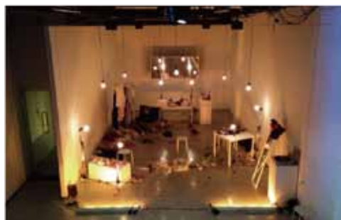
上：2014年公演「楽屋」の様子