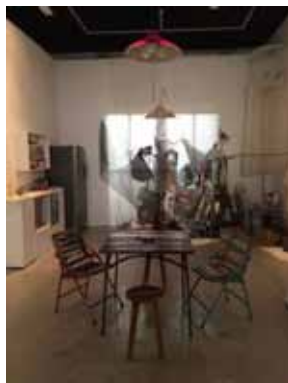
右：2015年公演「CAKE FOR BREAKFAST」の様子